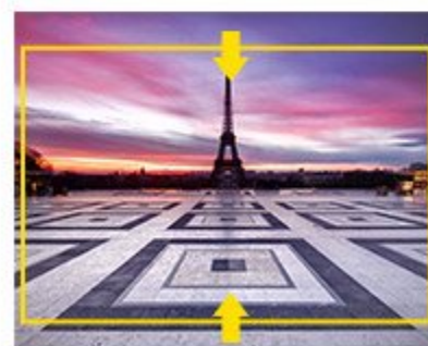
① 왜곡된 화면 ② 상하를 조정합니다.