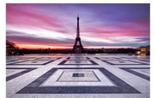
③ 일반 사각형 화면으로 보정 완료