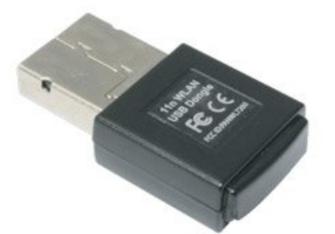
Optional Wi-Fi Dongle AH-B34020

(Wi-Fi 동글 AH-B34020: 옵션구매) 또한, Crestron Electronics 제어장치와 관련 소프트웨어를 지원합니다. (예시, RoomView®)